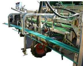
落とし込み供給装置 (オプション)