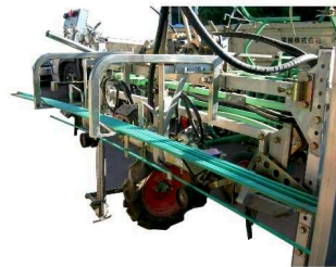
落とし込み供給装置付